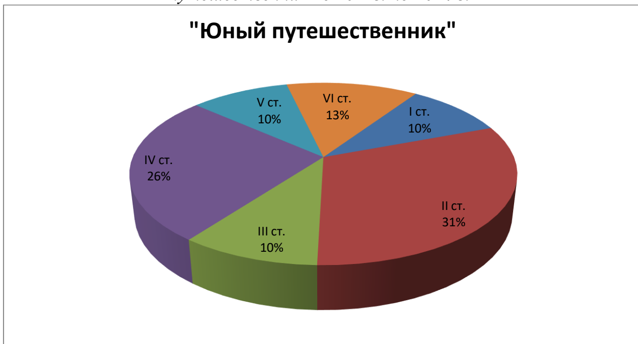
Таблица 5. Количество обучающихся, награжденных знаком отличия «Юный путешественник» с 2021г. по 2024 г.