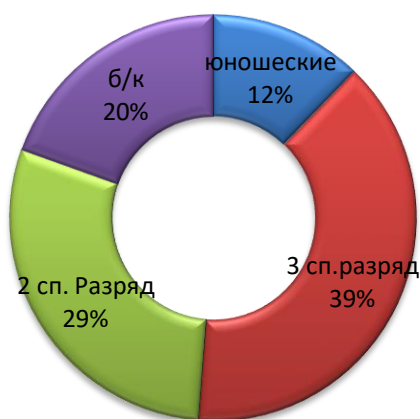
Таблица 4. Количество обучающихся, получивших спортивные разряды (2021-2022, 2022-2023, 2023-2024 учебные года)